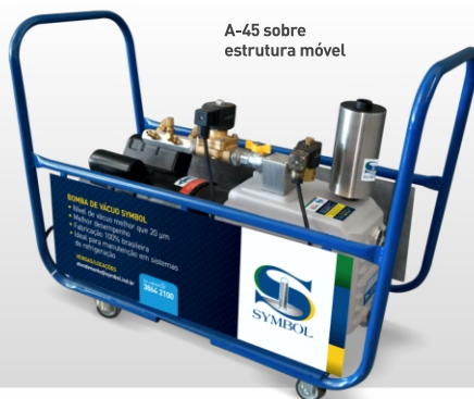
A-45 sobre estrutura móvel