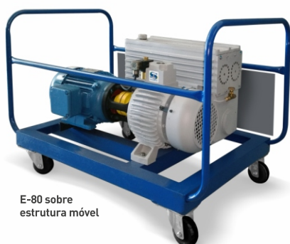
E-80 sobre estrutura móvel